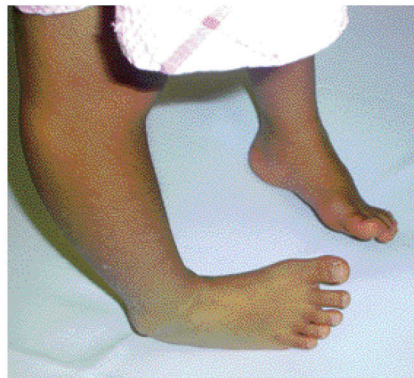
足の外側縁での歩行