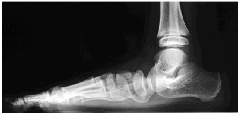
足部のX線像でアーチの低下を評価

立ったときにかかとが外を向いているかどうか、足のアーチが低下するかどうかを検査します。幼児期の子どもでは足の裏の脂肪が厚く、扁平足でなくても土踏まずが分かりにくいことがあるので、注意が必要です。重症度は体重をかけたときの足部のX線像で診断します。