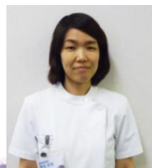
感染管理認定看護師