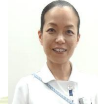
緩和ケア認定看護師