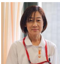
がん化学療法看護認定看護師