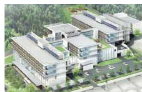
新病院完成予想図

規模：SRC・免震構造/地上4階 塔屋1階 敷地面積 27,446㎡/建築面積 7,297㎡ 延面積 20,728㎡/建物軒高 17m