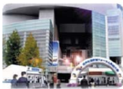
会場のイメージパース

開会式典に引き続き、山田太鼓、津野山古式神楽や高校生の吹奏楽演奏・合唱、よさこい踊りなどにより高知県の魅力を全国に発信します