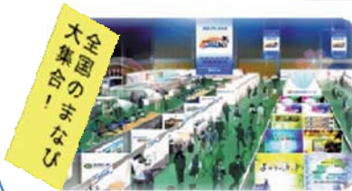
全国生涯学習情報発信市・体験ひろば