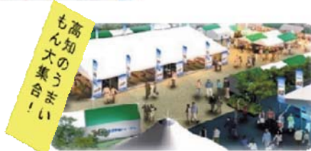
地産外商・食育展