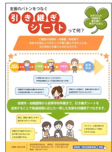
「支援のバトンをつなぐ引き継ぎシートって何？」リーフレット表紙

なお、「引き継ぎシート」は、県教育委員会特別支援教育課のホームページからダウンロードできますので、ご活用ください。