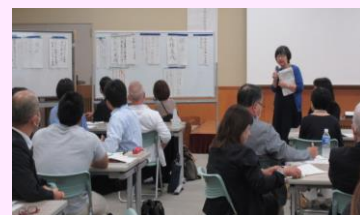
令和5年度地域コーディネーター研修会

子どもの「確かな学力、健やかな体、豊かな心」の育成に向け、地域との関わり意義や必要性について、コミュニティ・スクールや地域学校協働本部に参画する関係者の理解を一層深めるために、地域学校協働活動研修会により多く参加していただくよう呼びかける取組を進めていきます。