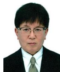
高知県教育長 長岡 幹泰