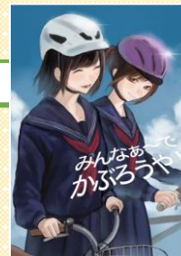
令和6年度ポスター