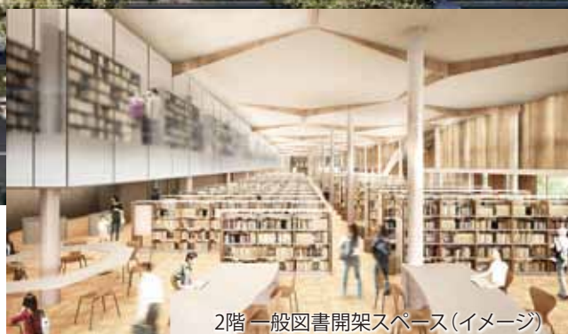
2階一般図書開架スペース(イメージ)