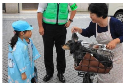
頑張って声をかけ、啓発グッズを手渡しました!