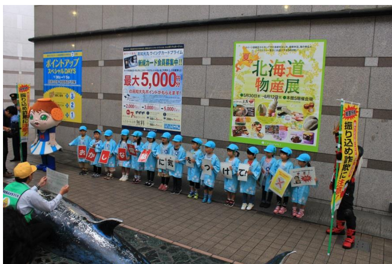
元気な声で被害の防止を呼び掛けました!