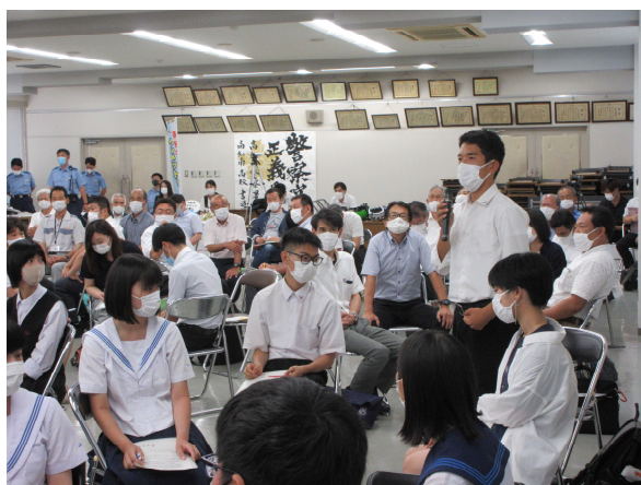
グループディスカッションの様子

講演の後には、「皆がヘルメットを着用するためにはどうすればよいか」をテーマに、参加者全員で話し合いも行われました。日頃、ヘルメットを被っていない生徒からは、「ヘルメットが命を守るために大切なことがわかった。これからは自分がヘルメットを被ったり、重要性を周囲に広めたりしていきたい」など、今後の自分自身の行動について、前向きな声が多く聞かれました。