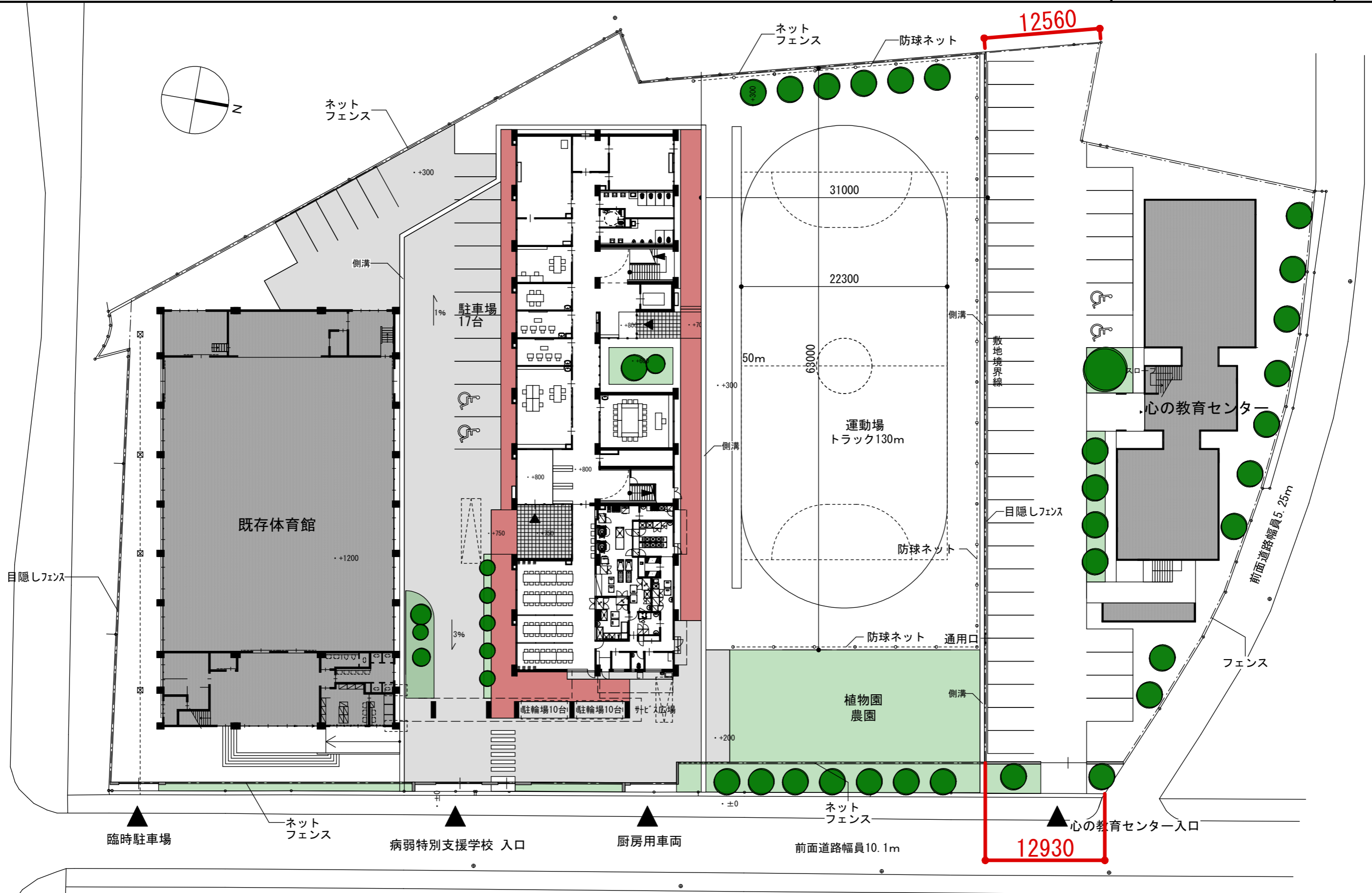
配置図 1 : 400