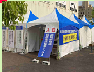
※写真は、GW時のものです。