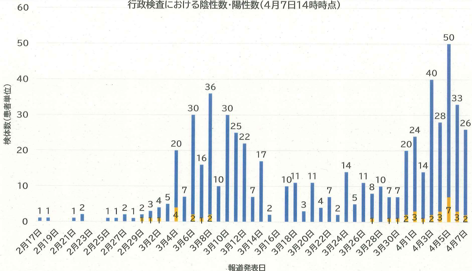
行政検査における陰性数・陽性数(4月7日14時時点)