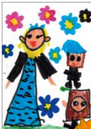
大胆な色づかいが、 とても鮮やかでキレイ。