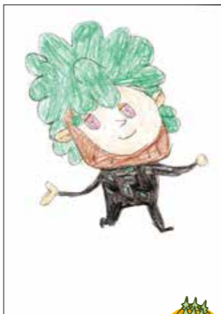
森の妖精の、のほほんとした 空気感がかわいい。