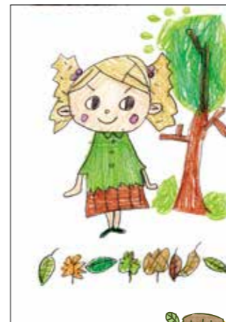
優しい色合いと線が好き。 表現にすこ味があるね。