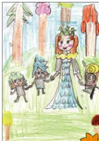
みんなの仲の良さが伝わる、 あたたかい絵になっているね。