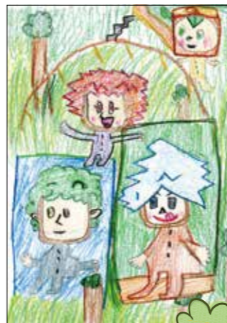
身近に森があるのかな? 見る側の想像を膨らませて くれる絵になっているわ。