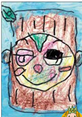
独特の色づかいとタッチが、 いい雰囲気を出しているわ。