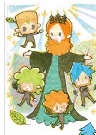
可愛らしい色合いで、 森のイメージを上手に 表現しているね。