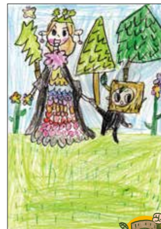
森の楽しさが伝わって、 ウキウキするよ。