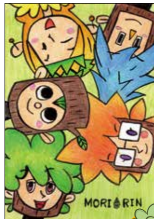
みんなが顔を寄せて 笑っている構図がとてもいいの。 色づかいも上手ね。