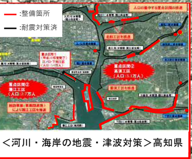
<河川・海岸の地震・津波対策>高知県