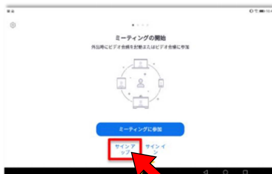
タブレットの場合