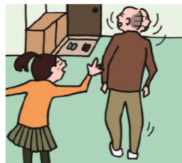
目を離せない家族の見守りや声かけなどの気づかいをしている