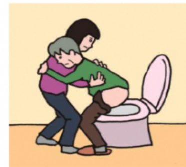
障がいや病気のある家族の入浴やトイレの介助をしている