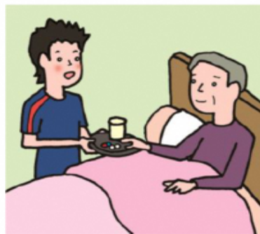
がん・難病・精神疾患など慢性的な病気の家族の看病をしている