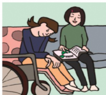
障がいや病気のあるきょうだいの世話や見守りをしている