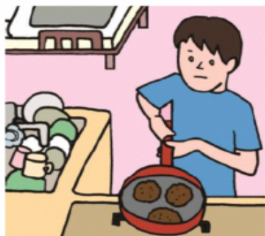
障がいや病気のある家族に代わり、買い物・料理・掃除・洗濯などの家事をしている

家族にケアを要する人がいる場合に、大人が担うようなケア責任を引き受け、家事や家族の世話、介護、感情面のサポートなどを行っている18歳未満の子どもをいいます。