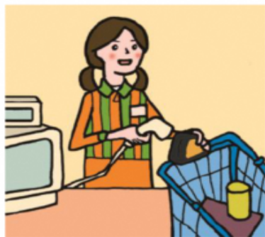
家計を支えるために労働をして、障がいや病気のある家族を助けている