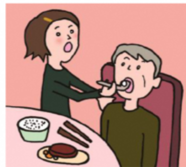
障がいや病気のある家族の身の回りの世話をしている