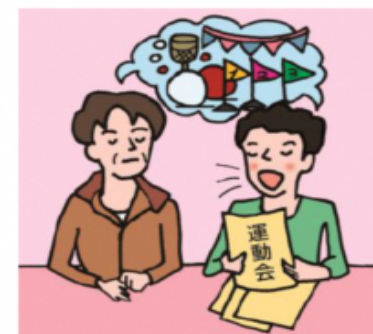
日本語が第一言語でない家族や障がいのある家族のために通訳をしている