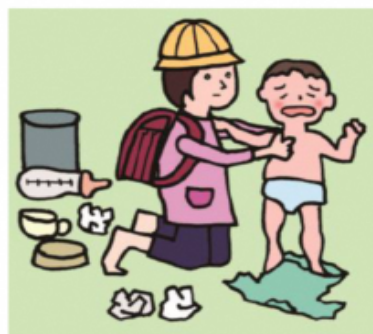
家族に代わり、幼いきょうだいの世話をしている