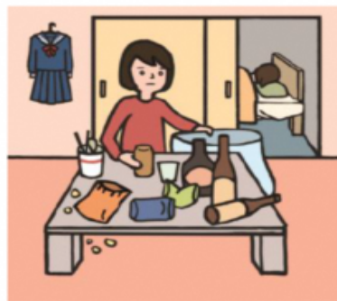
アルコール・薬物・ギャンブル問題を抱える家族に対応している