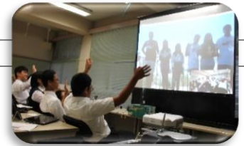
▲遠隔システムを活用した海外交流