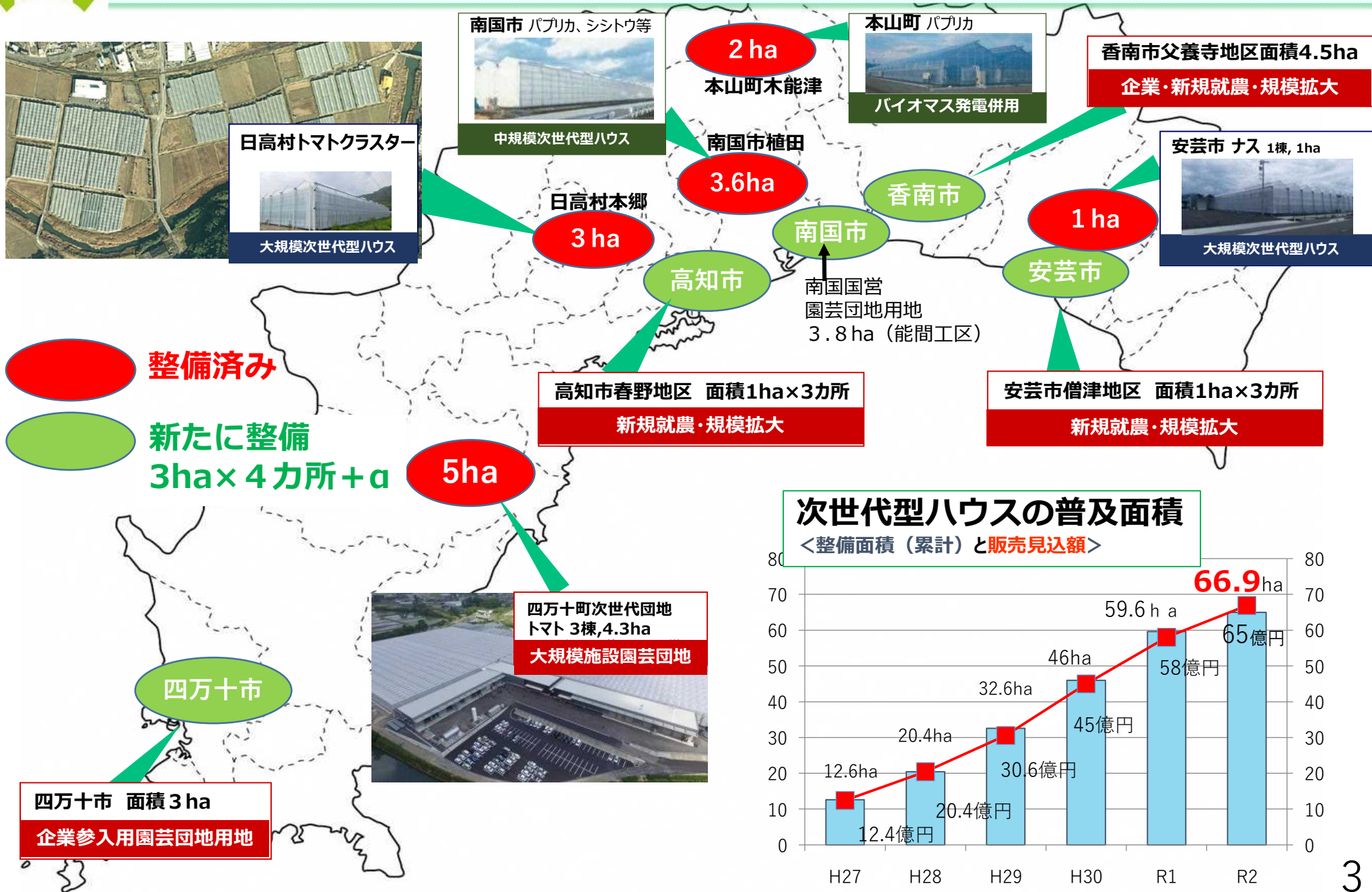
次世代型ハウスの普及面積