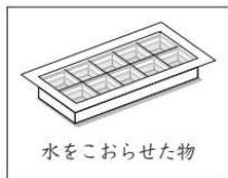
水をこおらせた物

2 たろうさんたちは、紅茶を冷やしたり、あまくしたりして飲むために、水と砂糖水を冷とう庫でこおらせることにしました。