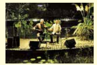
生演奏が月夜の風情を盛り上げる