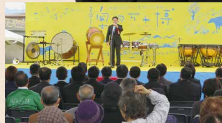
昨年4月10日～12月25日に開催した「2016奥四万十博」は、県内外から大勢のお客様で賑わいました。