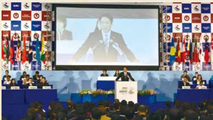
将来の防災リーダーの育成を目的とした「世界津波の日」高校生サミットin黒潮を昨年11月に開催しました。