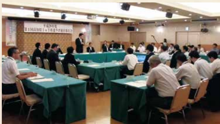
昨年7月25日に「高知県IoT推進ラボ」を発足し、県内産業の生産性の向上などに取り組んでいます。