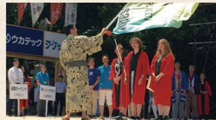
昨年8月のよさこい祭りに世界6カ国7チームの代表などをお招きし、よさこいの魅力などを発信していただく「よさこいアンバサダー」に認定しました。