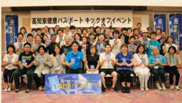
楽しみながら日々の健康づくりに取り組める「高知家健康サポート」が昨年9月1日よりスタートしました。