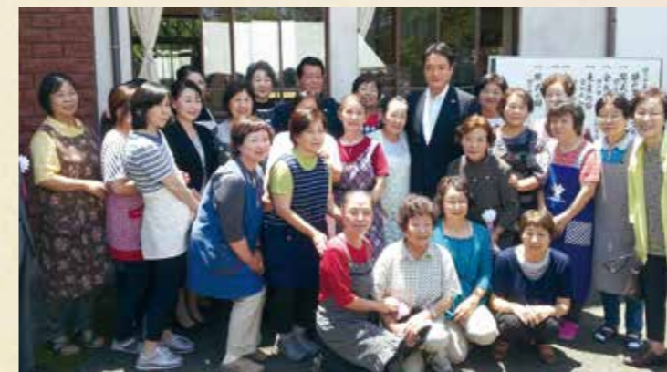
昨年4月に県内29カ所目となる姫ノ井集落活動センター「姫の里」が大月町に開所されました。