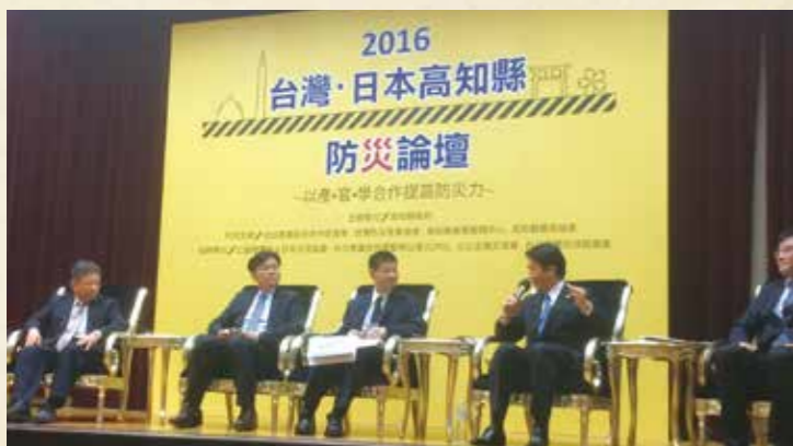
高知の防災関連製品・技術のトップセールスを行うため、昨年9月にフィリピン、10月に台湾を訪問しました。(写真は台湾訪問時)

本年も県勢浮揚目指して全力で頑張ります。県民の皆様からの「指導」ご鞭撻を心よりお願い申し上げます。