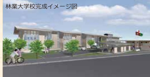
林業大学校完成イメージ図

平成27年に林業学校を先行開校し、研修生は林業の就業に必要な知識や技術を学んでいます。林業現場のニーズに対応した研修内容と、研修生の希望に沿ったきめ細かな就職指導により、これまでの卒業生全員が県内の林業関係の事業所に就職し活躍しています。