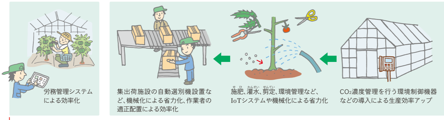
例 ハウス園芸における生産性向上の取り組み

IOT(モノのデジタル化・ネットワーク化)とは「Internet of Things」の略で、日常の身の回りにあるあらゆるモノがインターネットにつながって効果的に活用される仕組み