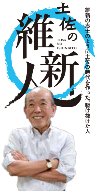
維新の志士のように土佐の時代を作った、駆け抜けた人

問い合わせ 県庁産業創造課 IoT推進室 TEL 088・823・9751 FAX 088・823・9261 E-mail kochi-iot@ken.pref.kochi.lg.jp