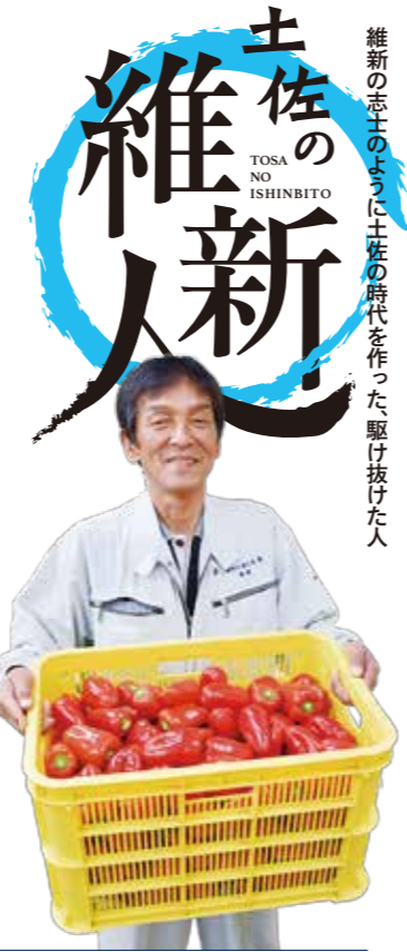
維新の志士のように土佐の時代を作った駆け抜けた人

5年間で94人を受け入れたインターンシップでは、11人が嶺北地域に移住し、その内4人がれいほく未来へ就職。「中でもこだわりを持った熱い男が2人いるんです」と紹介してくれたのは、