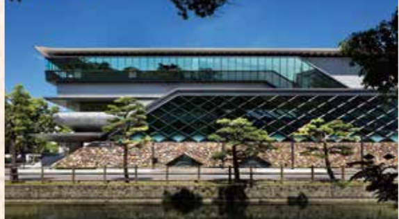
高知城歴史博物館の開館

昨年3月から2年間にわたり開催される「志国高知 幕末維新博」には、県内外から多くの方にお越しいただいています。