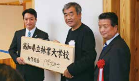
高知県立林業大学校の新校舎落成

集落活動センターの取り組みは、県内26市町村41カ所に広がり、地域の課題やニーズに応じたさまざまな活動が行われています。(平成29年11月末現在)