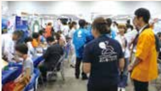
移住就職相談会「高知暮らしフェア」の様子(6月)

若者定着と並んで移住促進の取り組みが、高知にとって人材確保の観点からも極めて重要であることは言うまでもありません。昨年10月には多くの皆さまのご参画を得て「移住促進・人材確保センター」が開所しました。「後継者が欲しい」「新たな事業の担い手たる人材求む」そうしたニーズをこのセンターに集め、都会に向けて強力に発信する取り組みが、今、オール高知の体制で加速しています。移住者の皆さまにも関心を持っていただける提案が、今後どんどん発信されていくはず