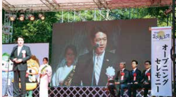
「志国高知 幕末維新博」の開幕

高知県移住促進・人材確保センターを開所し、移住の促進や人材確保の取り組みを官民協働で進めています。