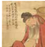
中山高陽《酔李白図》1767年 絹本彩色