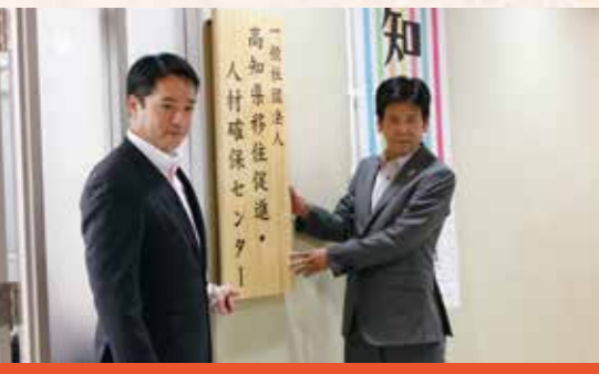
一般社団法人高知県移住促進・人材確保センターの開所

昨年2月に開催した第5回高知龍馬マラソンには、国内外から、1万人を超えるランナーに参加いただきました。