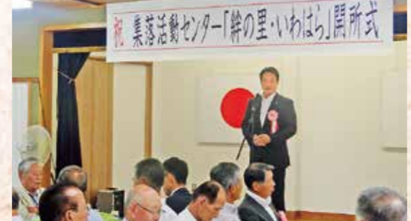
集落活動センターの取り組み

子どもたちに食事と地域の方々との交流の場を提供する「子ども食堂」の取り組みが県内49カ所に広がっています。(平成29年11月末現在)