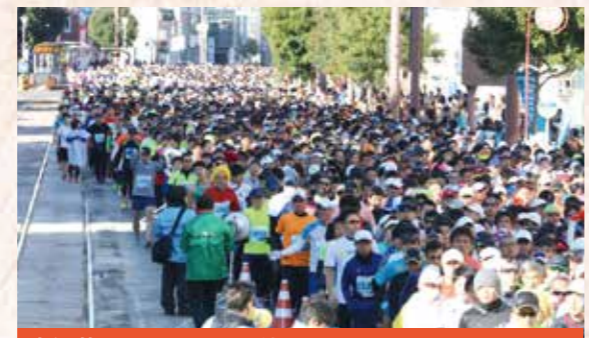
高知龍馬マラソンの開催

今年4月からは維新博も第二幕の開幕を迎えます。今年も全力で頑張ります。県民の皆さまからのご指導、ご鞭撻を心よりお願い申し上げます。