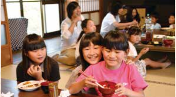
子ども食堂の取り組み

土佐藩主山内家伝来の資料の展示を中心に、日本と高知の歴史を学べる博物館として昨年3月に開館し、17万人以上の方々に観覧いただいています。