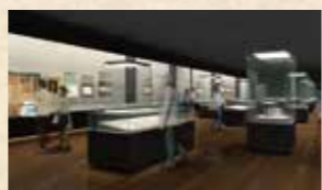
新館展示室(イメージ)