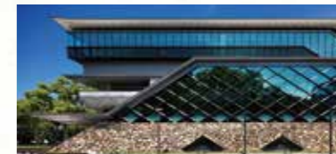
高知城歴史博物館