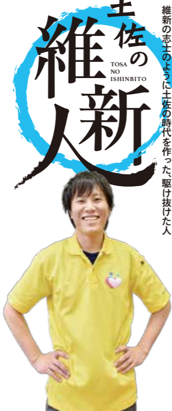
維新の志士のように土佐の時代を作った駆け抜けた人

「私たちがいきいきと働く姿を見せたい」と新しい人材は育ちません。だからこそ、NEXTが中心になって盛り上げていくと動いています」