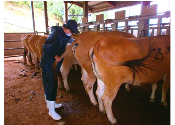
家畜人工授精講習会