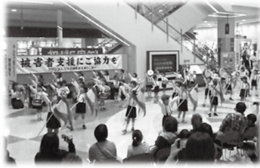
啓発イベントの様子(イオンモール高知)

平成27年12月1日(火)、認定NPO法人こうち被害者支援センターは、日本司法支援センター「法テラス」とイオンモール高知で啓発イベントを開催しました。