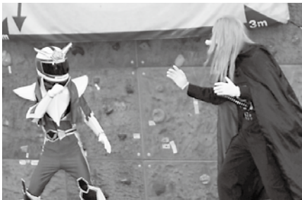
怪人へゴナーと戦う「嶺北特捜レイホーク」!