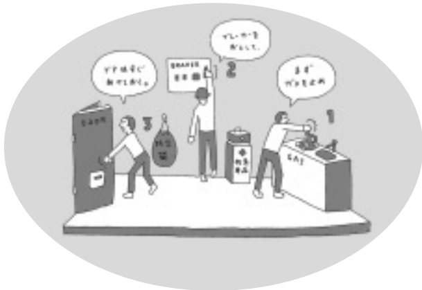
地震が起きたとき自分は こうできると思っていた