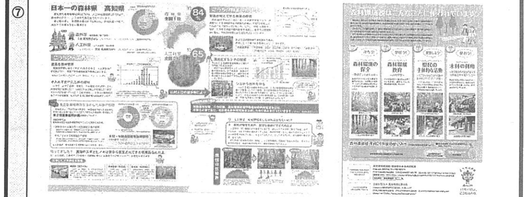
ポケットフォルダ中面(H25)