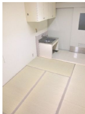
<和室6畳> シンク 棚 照明台 電気スタンド