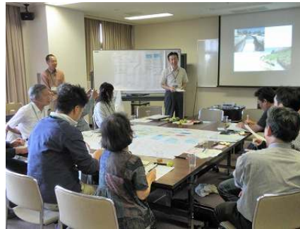
第1回目ワークショップの様子