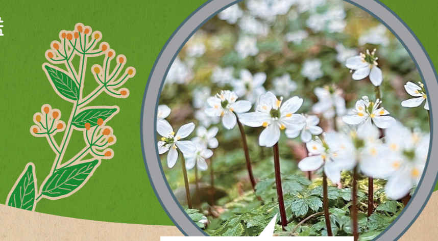
バイカオウレン (見ごろ:1月下旬~3月上旬まで)