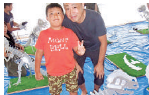
子ども向けの「ものづくり教室」を開催