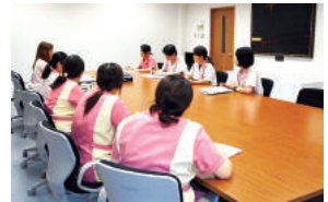
職場の環境改善に取り組むための話し合いを積極的に実施

職場の環境改善に取り組むため、従業員から業務の効率化や働きやすい職場づくりに関する意見を募る「改善提案制度」を実施。残業を前提とする「ノー残業デー」から残業を例外的なものとして捉える「残業可能日」に制度を転換。また、産休・育休中の従業員に毎月社内情報誌を送付し、スムーズに職場復帰ができるよう、働きやすい環境づくりに努めている。