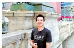
勤続年数に応じて付与されるリフレッシュ休暇を有効に利用