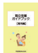
仕事と育児の両立を支援する「両立支援ガイドブック」を作成