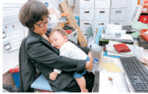
子連れで出勤した際は社長室で子どもを預かっている

子連れ出勤を可能にし、社長室で預かりを実施。時間単位での年次有給休暇や、時間単位の看護休暇等を導入しており、乳幼児健診など短時間の所用の際に利用されている。社員旅行など家族同伴でのイベントを開催し、家族ぐるみでの交流を図っている。子育て中の社員は定時退社を徹底するなど、家族のために時間を作れるようサポートしている。