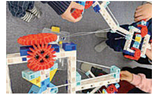
プログラミング教室は子どもたちに大人気

子どもたちの学びの機会創出の一環として、小学生向けのロボットプログラミング教室を開催。防災学習でのドローン撮影にも協力している。社内では自社開発のシステムを使い、従業員同士で業務を共有。子育て中の社員に限らず急な早退や休みの場合も、別のスタッフで対応できる体制を整備。また、会社からの声かけにより、男性社員が約1週間の育休を取得した。