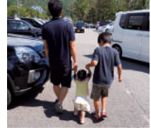
社内のサポート体制により男性社員も育児休業を取得

従業員の育児休業取得促進のため、育児について家族で話し合うための「育児計画シート」や育児休業の希望を事前に確認する「育児参加計画書」を作成。これらを活用して社内でのサポートや業務の調整を行っている(男性社員の育児休業取得実績あり)。また、仕事と育児の両立を支援するガイドブックの作成・配布や相談窓口を設置し、男女問わず育児へのサポートを行っている。