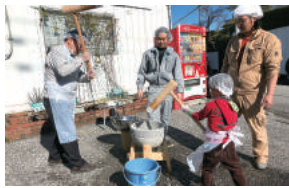
社員の家族や周辺住民も参加する餅つき大会を開催