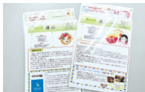
従業員同士のコミュニケーションを図るため社内誌を配布

有給休暇の取得促進のため、定期的に取得状況を確認し、計画的な取得を呼びかけ、休暇などの申請や届出の電子化により、手続きを簡素化するなど、働きやすい職場づくりに取り組んでいる。また、従業員同士のコミュニケーションを図るため、社内誌の配布や誕生日カードの贈呈を行っている。そのほか、結婚、出産や子どもの入学の際はお祝い金を支給するなど、子育てでのサポートも実施している。