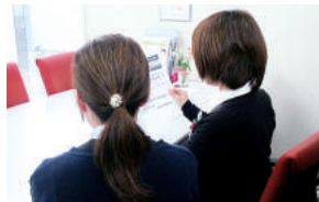
従業員の誕生日にはカードを贈っている