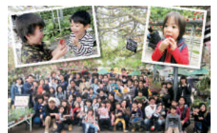
従業員の家族も参加する親子遠足を開催し、家族ぐるみで交流