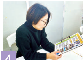
社内メールで共有