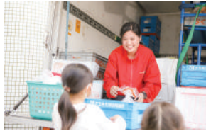
地域への宅配とあわせて子ども達の安全を見守る

地域の子どもの登校時の見守り活動や、県等と協定を締結し、宅配事業の基盤を活用した地域の見守り活動を実施している。また、マネジャー（所属長）を対象とした研修会（労働時間の適正な把握に関するガイドライン）を実施し、意識づくりを進めている。職員に対しては、年間5日を含む年次有給休暇の取得促進に向けて、働きかけの強化を行なっている。