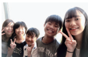
時間単位で育児休暇が取得でき、育児中も働きやすい環境がある