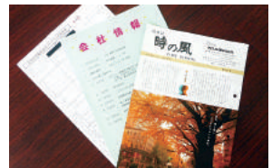
産休・育休中の従業員に社内情報誌を送付し、共有