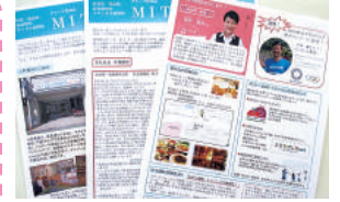
社内報を発行し、休暇中の社員と情報共有を図っている

産休や育休取得後の復帰率は90%以上。子育て中の社員への理解と協力体制があり、子どもの事情での早退や、休暇などを取りやすい雰囲気をつくっている。男性社員が育児短時間勤務制度を利用した実績があり、男性、女性問わず仕事と育児を両立できる環境がある。また、育休中の社員へも社内報を送付し、スムーズな職場復帰ができるよう情報共有を図っている。