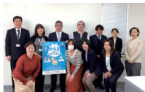
「マイセレクト」導入で生活に合わせた働き方をサポート

4パターンの時差出勤制度「マイセレクト」により、個々のライフスタイルに合わせた働き方ができる。さらに、5日間連続で取得できる特別休暇制度も導入している。また、昼休みにプラス2時間の休暇取得も可能で、突発的な急用などに利用できる。週に1回のノー残業デーの導入や、子育て中の従業員は完全定時退社を徹底するなど、働き方改革に積極的に取り組んでいる。