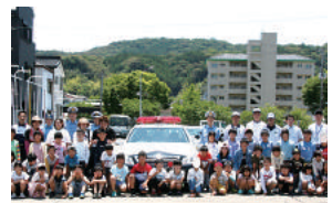
小学生や高齢者向けの交通安全教室を毎年開催

幹部内で定期的に検討会を実施し、従業員の勤務状況を把握し、時間外労働を削減するよう努めている。年間10日の有給休暇の取得を義務付け、取得率は100%。時間単位での年次有給休暇制度も導入している。また、子育て中の従業員が無理なく働けるよう、学内託児所を利用することができるほか、従業員同士が相談し合いながら、休みや早退に対応している。