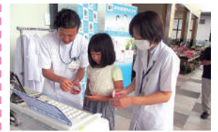
毎年開催するイベントでは子どもたちが薬剤師を体験