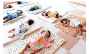
院内託児施設は仕事と育児の両立をサポート

過去5年間で育児休業を取得した従業員が300名近くおり、男性も取得実績がある。管理職を対象に育児休業に関する研修の実施や、半年に一度、従業員の働き方に関する話し合いを行い、育児休業を取得しやすい職場づくりに取り組んでいる。また、病院内に24時間対応の託児施設を設置するなど、子育てしながら働ける環境を整え、育児休業復帰後の従業員をサポートしている。