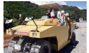
「子供どぼくキャンプ」は子どもたちが土木に親しむ機会となっている