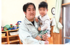
5日間の出産・育児特別休暇を積極的に取得

男性社員に5日間の出産・育児のための特別休暇を付与しており、対象者は気兼ねなく取得できる風土がある。また、子育て中の社員からの要望を受けて時差出勤制度を導入。女性社員だけでなく、男性社員も利用している。現在は半日単位の年休取得が可能だが、今後は現場のニーズに沿った、社員にとってより働きやすい制度の導入を検討予定。