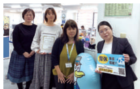
希望に応じた休暇取得を可能にして、従業員の育休取得を応援