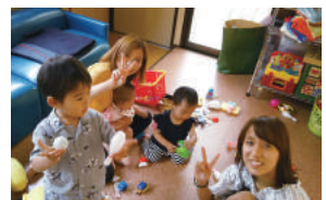
従業員同士が相談し合い、子育て中も無理なく働けるよう協力