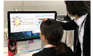
システムを活用し業務の情報共有を図っている