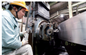
社員からの要望を受け導入した時差出勤制度は、男性社員も利用