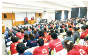
年2回行う全体研修では職員の働き方への理解を深める