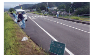
清掃活動を通して地域貢献に尽力している

交通安全週間には登校時の旗振りを実施するほか、月に1回、近隣の小学校までの片道2kmを清掃。また、子どもたちが土木に親しめるよう、「子供どぼくキャンプ」の参加者を積極的に受け入れている。社員の家族も参加し、交流を深めている。時間単位の看護休暇や育休復帰後の一部在宅勤務、制度に関する相談窓口の設置など子育て中の社員への支援体制も整えている。