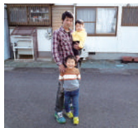
男性社員が有給で2週間の育児休暇を取得

2週間以内の育児休暇は有給で取得が可能であり、男性社員も取得実績がある。法を上回る日数で看護休暇の取得ができるうえ、時間単位での取得も可能なので、子育て中の社員は有効に活用できる。時間単位での年次有給休暇制度も導入している。今後も育児休暇復帰後の勤務形態などを柔軟に検討し、女性も男性も育児休暇を取りやすい環境をつくっていく。