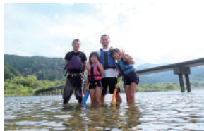
休暇を積極的に取得し、家族と過ごす時間を大切にしている

年次有給休暇の時間単位取得はもちろん、育児休暇(育児目的休暇制度)についても時間単位での取得が可能。子育て中の急用にも対応しやすい環境を整えている。また、育休から復帰後は夜勤を免除するなど、従業員の子育てを応援。年次有給休暇もほぼ完全消化しており、仕事と家庭を両立できる環境づくりを進めている。