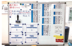
残業時間を可視化することで、削減を意識付け

業務のIT化による作業改善、環境整備を推進し、業務効率アップに取り組んでいる。日々の残業時間を累計し、事務所に掲載することで、残業時間削減への意識を醸成。また、育休取得対象者に声かけをしており、男性社員も取得(約3か月間)。夏休みには子どもを対象に「ものづくり」教室を開催し、子どもたちのものづくりへの関心向上に貢献。