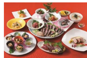
秋のコースメニュー