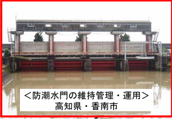
＜防潮水門の維持管理・運用＞ 高知県・香南市