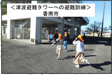
＜津波避難タワーへの避難訓練＞ 香南市