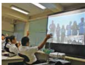
▲海外の友だちとオンライン交流