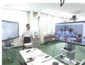
▲小規模高校への遠隔授業の配信