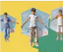
ウォン・ホイチョン「ああ、スルクレ わが町スルクレ」2007年