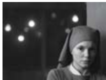
「イーダ」 配給:マーメイドフィルム