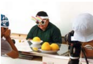
▲プロジェクト第1弾 スターの動画出演の様子