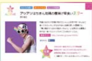
▲高知家サイトでのスター紹介例

高知家ウェブサイト(「高知家」で検索)内の、「高知家のスターに応募」をクリック →1年を通じて登録可能ですので、ぜひ登録ください。