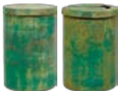
経筒2口 土佐清水市足摺峠伊佐塚出土 東京国立博物館所蔵

日 10月9日(金)~12月6日(日) 東京国立博物館に所蔵されている県内未公開の高知県ゆかりの出土品や陶磁器を展示。