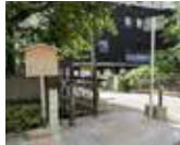
河原町の土佐藩邸跡

日 1月23日(土)～3月31日(木) 当館所蔵の「土佐藩邸史料」から、土佐藩邸があった京都・河原町を中心に、幕末の京都に関する資料を展示。 河原町の土佐藩邸跡