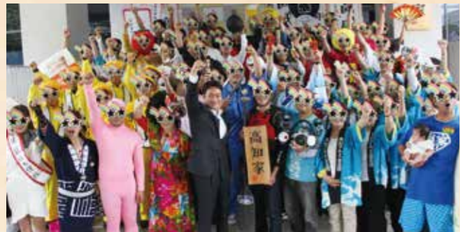
高知家プロモーションでは、1,400人を超えるスター登録など、県民の皆さまに直接ご参加いただきました。

「飛躍への挑戦！」を今新たなステージへ。3期目も県勢浮揚に向けて全力で頑張ります。県民の皆さまからのご指導ご鞭撻を心よりお願い申し上げます。