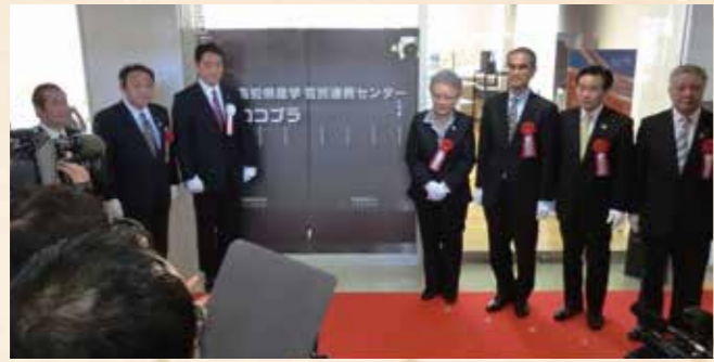
昨年4月に開所した「産学官民連携センター・コプラ」では、アイデアをビジネスにつなげるサポートなどを行っています。