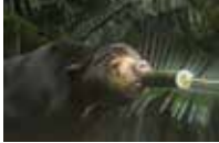
マレーグマが恵方巻きを食べる様子

日 2月3日(水)11時 飼育スタッフ特製の恵方巻きを動物たちにプレゼントします。