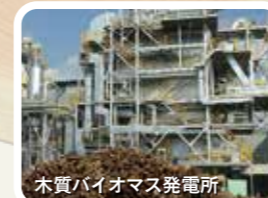
木質バイオマス発電所

また、低質材(小径木や大きく曲がった木、枝葉部分など)を燃料とする木質バイオマス発電所が、昨年1月に宿毛市、3月に高知市で操業を開始。フル稼働時には、1年間で約20万㎡の低質材が活用され、約8万5千キロワット(約2万3千世帯分)もの電力を生み出します。