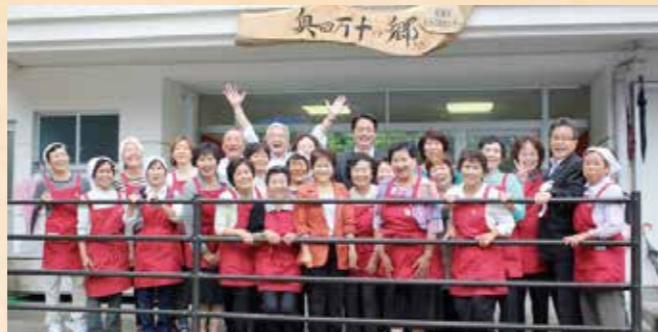
昨年6月、県内18カ所目となる郷地区集落活動センター「奥四万十の郷」が津野町に開所しました。