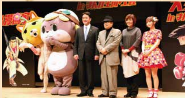
昨年2月に初開催した「全国漫画家大会議」には、全国から漫画家やファンが集結。今年は3月5日・6日に開催予定です。