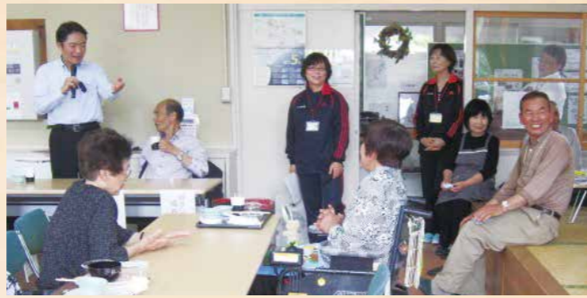
県内の全市町村を回らせていただいた「対話と実行行脚」が昨年6月10日に終了。地域地域の住民の皆さまから貴重なお話を伺いました。