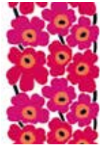
ファブリック:《ウニコ》(けしの花) 図案デザイン:マイヤ・イソラ、1964年 Unikko pattern designed for Marimekko by Maija Isola in 1964

日 1月23日(土)～3月27日(日) フィンランドのデザインハウス「マリメッコ」の60年の歴史や個性あふれるデザイナーの活躍を紹介する国内初の大展覧会です。 料 当日1,100円(大学生800円) 前売900円