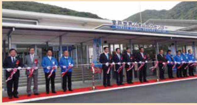
昨年4月29日～12月23日に開催した「高知家・まるごと東部博」は、県内外からの大勢のお客さまで賑わいました。