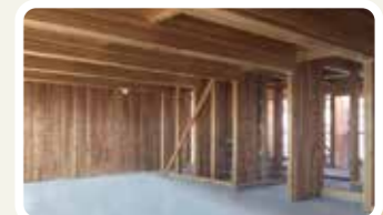
平成26年3月に完成した全国初のCLTによる建築物「高知おとよ製材の社員寮」に続き、今年中にはCLTを活用したモデル建築物が県内に5棟完成する予定です。