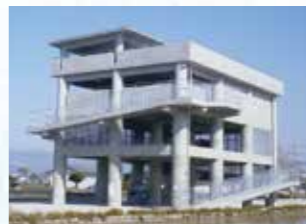
平成26年3月完成の津波避難タワー(南国市)

大震災の発生後に本県で推計した当時と比べ、大幅に減少する見通しとなりました。(図1参照) しかしながら、さらなる人的被害の縮小に向けて、住宅の耐震化や津波避難対策の実効性の確保など、まだまだやるべきことは多くあります。