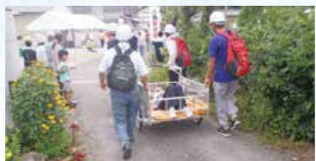
8月30日~9月5日は「高知県南海トラフ地震対策推進週間」です

9月4日(日)に、県内各地で地震による津波や土砂災害などの被害を想定した「県内一斉避難訓練」を実施します。地域の皆さまがお互いにお声掛けのうえ、積極的なご参加をお願いします。時間や場所、参加方法などについては、お住まいの市町村役場までお問い合わせください。