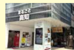
「まるごと高知」は6周年を迎えます

高知県地産外商公社による県内事業者の外商活動(食品関連)に対するサポートによって、昨年度、成約件数、金額ともに過去最高となりました。