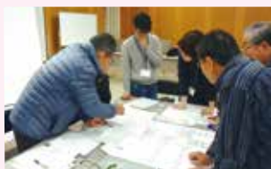
避難所運営訓練の様子

発災後数日は人命救助や応急復旧活動などを優先するため、避難所運営まで行政の支援が行き届かないことが想定されます。このため、地域の皆さまが主体となって避難所運営ができるよう、運営マニュアルの作成や運営訓練を行うことにより、発災時に対応できる実践力を高めましょう。