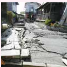
ブロック塀の倒壊