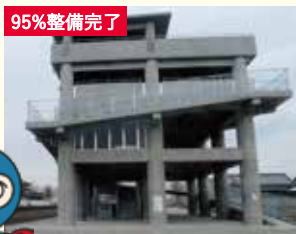
津波避難タワー 109箇所