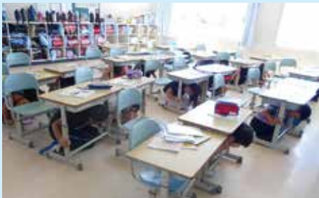
訓練の様子：土佐市宇佐小学校