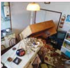
阪神・淡路大震災の被害状況