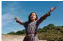
「シャネット、ジャンヌ・ダルクの幼年期」