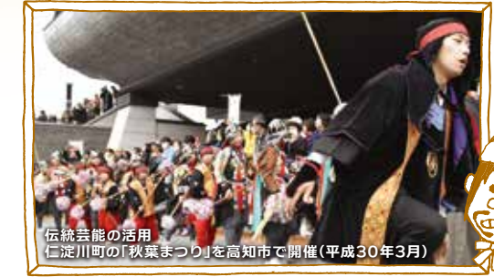
伝統芸能の活用 仁淀川町の「秋葉まつり」を高知市で開催(平成30年3月)

県内各地に伝わる伝統芸能などを後世に伝えるとともに、伝統的工芸品産業の振興を図る