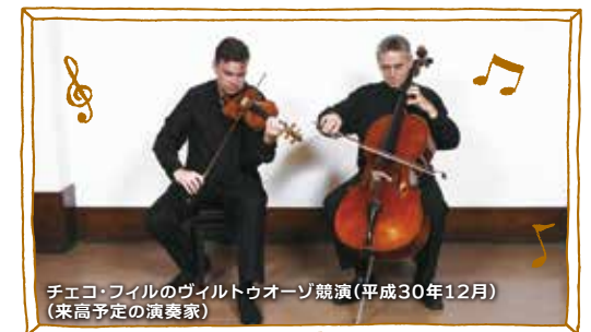
チェコ・フィルのヴィルトゥオーゾ競演(平成30年12月) (来高予定の演奏家)

東京オリンピック・パラリンピックの開催を契機とした東京キャラバンやチェコフィルハーモニー管弦楽団の演奏家による公演を開催 高齢者・障害者の文化芸術活動を促進