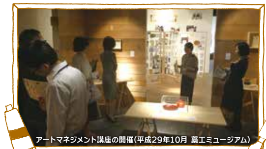
アートマネジメント講座の開催(平成29年10月 薬工ミュージアム)

観光振興や産業振興、地域の活性化に繋げることのできる人材を育成するために、文化人材育成プログラムを実施