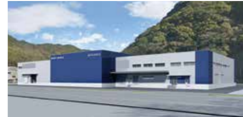
大型水産加工施設(イメージ図)