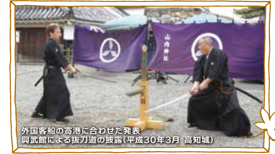
外国客船の寄港に合わせた発表 興武館による抜刀道の披露(平成30年3月 高知城)

暮らしの中で文化芸術に触れ、豊かな感性や創造性を育てていただくために、高知県芸術祭の充実や発表機会の創出を行う