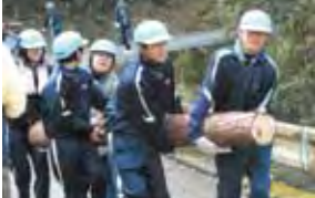
卒業生が間伐し運んでくれたヒノキが使われている。