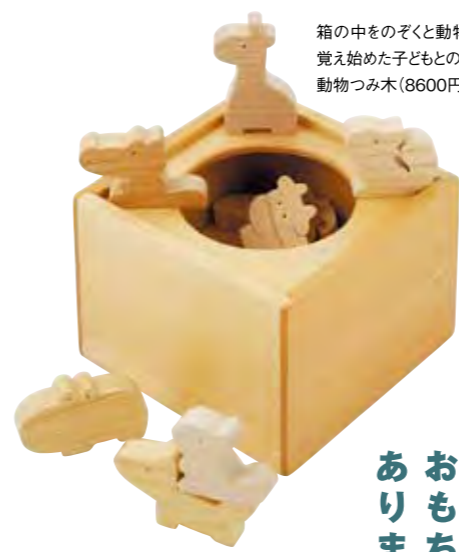
箱の中をのぞくと動物達がいっぱい。言葉 覚え始めた子どもとのコミュニケーションに。 動物つみ木(8600円)