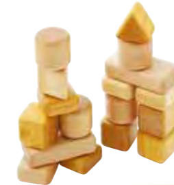
小さくて角が丸いから、赤ちゃんの カワイイ手でもつかみやすい。成 長してからも楽しめるおもちゃで す。赤ちゃんつみ木(8400円)