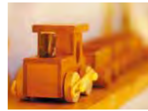
製品は一つひとつ職人さんによる手作り。大量生産はできなくても、手作りに宿るぬくもりを大切に考えられています。