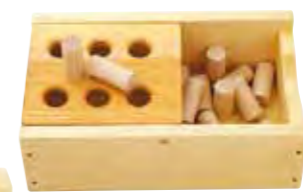
棒を穴に落としていくだ け。でも、子どもにとっては 楽しい遊びです。ふたは 左右に移動します。 棒おとし(7350円)