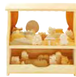
木の動物たちで色々な物語を聞か せてあげて。テレビでは得られない 楽しさや嬉しさが伝わります。 シアターズ(14700円)