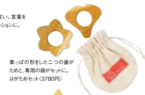
葉っぱの形をした二つの歯が ためと、専用の袋がセットに。 はがためセット(3780円)