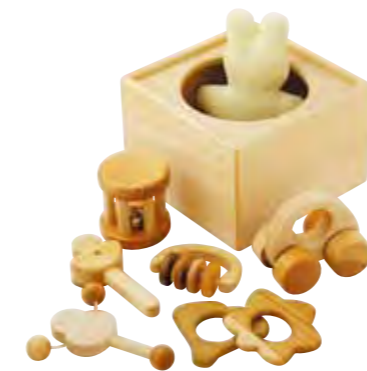
なかよしライブラリーが自社で初め て作った木のおもちゃ。20年以上 にわたり愛されています。 赤ちゃんセット/(12600円)