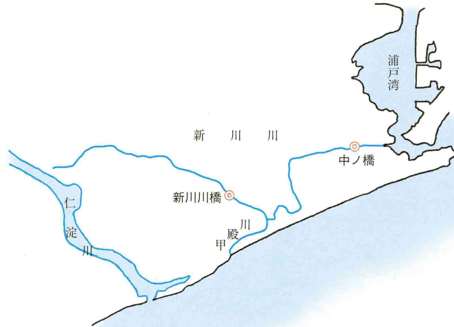
別図1 (新川川、派川甲殿川)