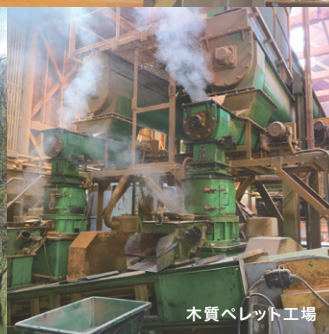
木質ペレット工場

定員 50名(先着順) 対象 高校生以上 募集開始 令和5年2月5日(日) 応募締切 令和5年3月5日(日)