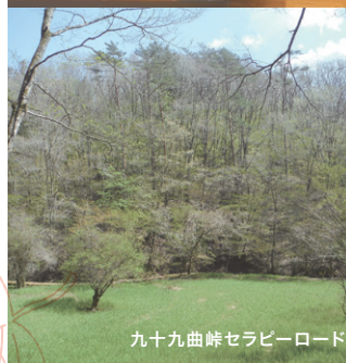
九十九曲峠セラビーロード