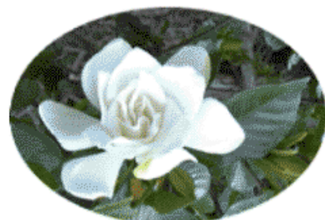
職員駐車場の周囲に咲いたクチナシの花。とても良い香りです。

季節の食卓 「トマトパワー☆」 〜栄養科〜 食卓を彩る真っ赤なトマトの季節です。皆さんと降り注ぐ太陽の光に負けないくらい鮮やかなトマトは「トマトが赤くなると医者が青くなる」といわれるほど薬効のある野菜として扱われています。 トマトの赤い色のもとにはリコピンといわれる色素の一種です。その抗酸化作用はベータカロチン（体内でビタミンAに変わる）の2倍もあります。皮膚や粘膜を守り、血液をさらさらにしてくれます。紫外線による肌の酸化を防ぎ、がんを抑制する働きもあります。 トマトが完熟するほどリコピンは増えます。生で食べるより加熱した方が吸収率が高くなります。ビタミンEの多い植物油（コーン油や大豆油など）で真っ赤なトマトを炒めて炒め汁ごと食べるのがおすすめです。また、冷え性の人や冷房の効いた部屋で一日中過ごす人は、生食はひかえめにしましょう。さあ、今日の献立はスープやパスタにたっぷりトマトを使うイタリア料理にしてみませんか。