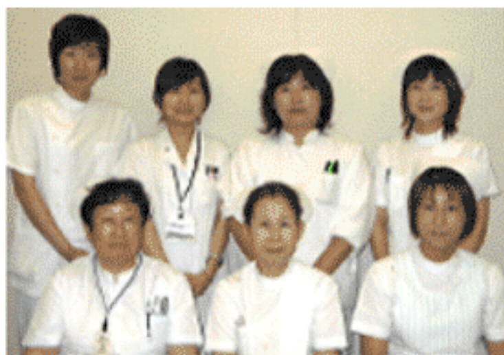
医師・管理栄養士・理学療法士・看護師で結成された嚔下チームのメンバー (一部です)

私たちは、患者さんとかかわりだけでなく、ご家族とかかわりを大切にし、ご家族とともに患者さんをサポートしていきたいと思っています。このたび「嚔下チーム」を立ち上げました。患者さんが「おいしく食べる」ことができるよう学び、実践していきたいと思えます。優しくたくましい、西5スタッフ26名、パワフルに頑張っています。