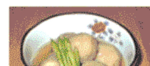
里芋はおもてたい食品の一つとしてお正月や行事の料理に用いられます。里芋は茎の肥大したもので、株の中心に大きな親芋があり、その周りに小芋が増えています。

煮物の場合は、塩でぬめりをすり落としから下茹でしたものを使うとえぐみがとれます。ぬめりやえぐみをあまりとり過ぎるときは独特の風味を損ないます。薄味にして汁も飲むようにすると栄養成分をまるごと摂取できます。