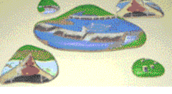
作品のごく一部です。

にも毎回記入いただいております。お手数をかかいたしますが、より正確な病状把握のため、よろしくお願