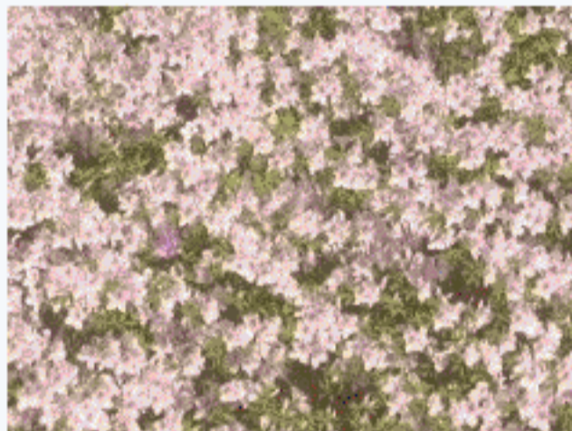
病院に咲くツツジのやわらかなピンク色です

その日、「今日、虹を見て、ここにもこんなに鮮やかな色があつたんだなあ」と思ってしばらくぼーっと見てた」と言ったあの人の言葉に、あたたかくて優しいものを感じました。そしてなぜかその言葉が私の心をあたたく優しくしてくれました。自然の色は、人の心をあたたく優しくしてくれ、そして、それはほかの誰かの心もあたたく優しくしてくれる。心が少し疲れた時、自然の色はあたたく優しく包んでくれる。そんな気がします。時間をつくって自然を感じてみませんか。