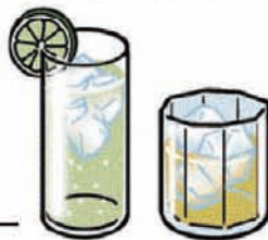
焼酎・ウイスキー