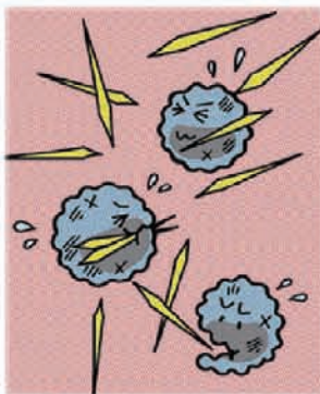
白血球に取りこまれた結晶

高尿酸血症の原因は様々です。生活習慣や体質によって腎臓から尿酸を排出する機能が低下したり、暴飲・暴食、肥満、激しい運動などが原因になると考えられています。降圧利尿剤などの薬物も誘因になることがあります。