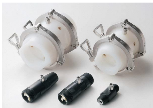
開発したファインバブル発生器

株式会社坂本技研は、高知工業高等専門学校が開発したファインバブル発生機構の技術シーズを活用し、共同で今までにない特徴を有するファインバブル発生器を開発しました。また、県や（公財）高知県産業振興センターの事業を積極的に活用し、地場産業の特徴を伸ばすために県内のJAや漁協、公設試（工業技術センター・農業技術センター）でチームを組み、現場使用を重ねながら産業技術として使用できるレベルまで高めました。ファインバブルの使用方法の開発まで踏み込んだことで、特に活魚の死滅を大幅に低減し、養殖における経済的リスクも大幅に軽減することに成功しました。さらに農業や工業の分野への取組にも効果が出ています。